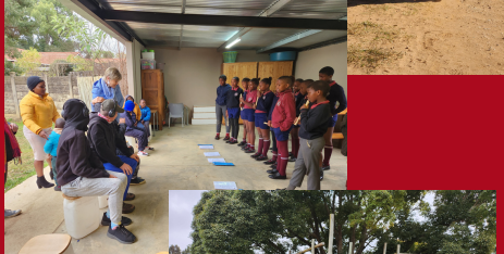
Visit to the Wings School