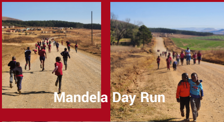
Mandela Day Run