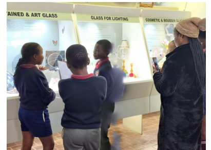
Grade 6 visit Talana Museum